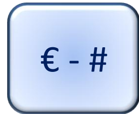
Opp. Croissance Key Issues